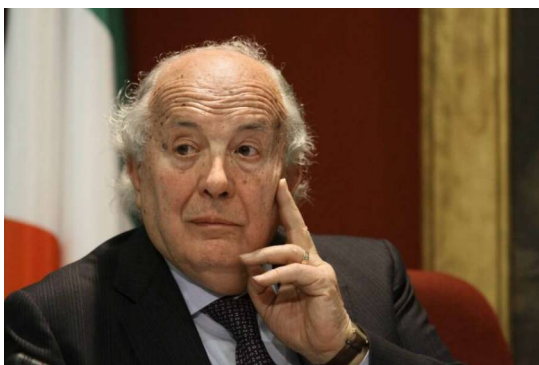
L'on. Gerardo Bianco

Si tratta di un contributo importantissimo, lungo una linea di compromesso fra ideale ed utile e di sintesi fra religione della Terra e pantheon greco, quello elaborato da rappresentanti della Nuova Accademia: Cicerone e Varrone. In risposta a Lucrezio, che aveva equiparato la religio alla superstizione, denunciandone per di più la cinica delittuosità nel sacrificio di Ifianassa, Varrone dà fondamento alla religione civile di Roma: quel che conta non è il credere in Giove e negli altri dei, secondo quanto cantato dalla poesia mitopoietica; la religio si giustifica come instrumentum regni . È uno dei fondamenti, forse il più importante, nel rapporto tra l'uomo-cittadino e gli dei che assicurano a Roma la sua stessa esistenza, attraverso la pax deorum . Varrone è poi importante anche per il rapporto fra omen e rito. Questo ne rappresenta l'evidenza nella celebrazione della festa religiosa, legame evidente tra Roma e le sue divinità. Nel De lingua Latina , Varrone lega strettamente la parola alla Verità, lungo il percorso della ricerca etimologica, cara allo stesso Cicerone. L'Arpinate tiene poi a valorizzare il rapporto tra religione e diritto. In chiusura del secondo libro del De legibus , con un voluto riferimento al Platone dei nómoi , Cicerone afferma che le leggi sono essenziali a mantenere insieme la struttura dello stato, constituta religione , una volta regolamentati i culti.